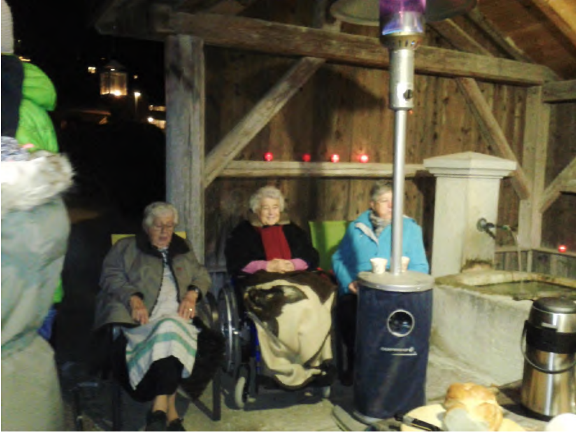
Les anciens de Bollion bien installés sous le gaz profitent aussi de ces retrouvailles

Fenêtres de l'Avent 2016 C'est toujours un plaisir de se retrouver à cette période où l'on ne se croise pas beaucoup dans les villages !