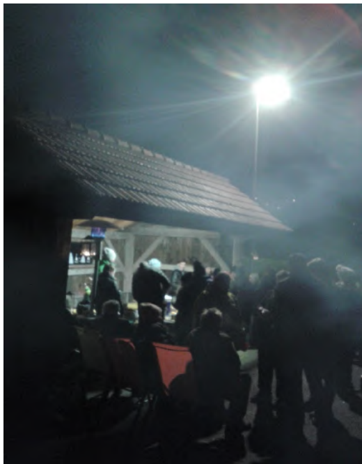
Foule sous la pleine lune à Bollion